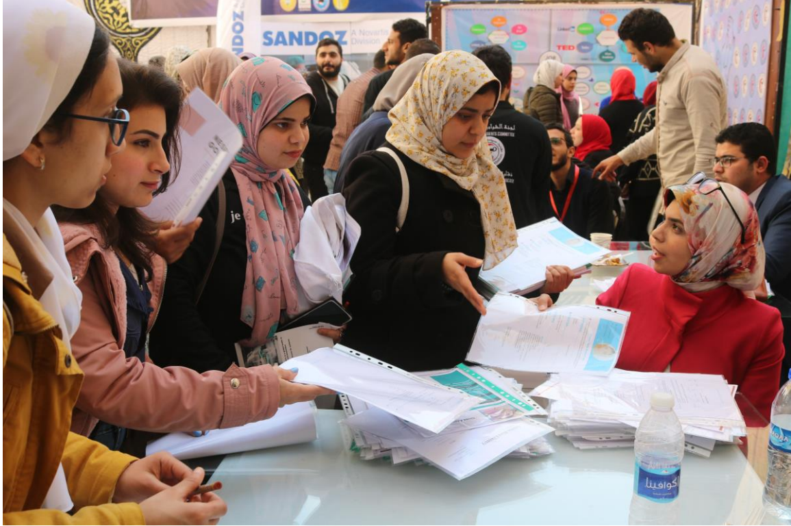
الملتقى التوظيفي السنوي فبراير 2020