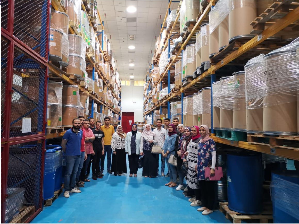
زيارة شركة أتكو فارما للصناعات الدوائية