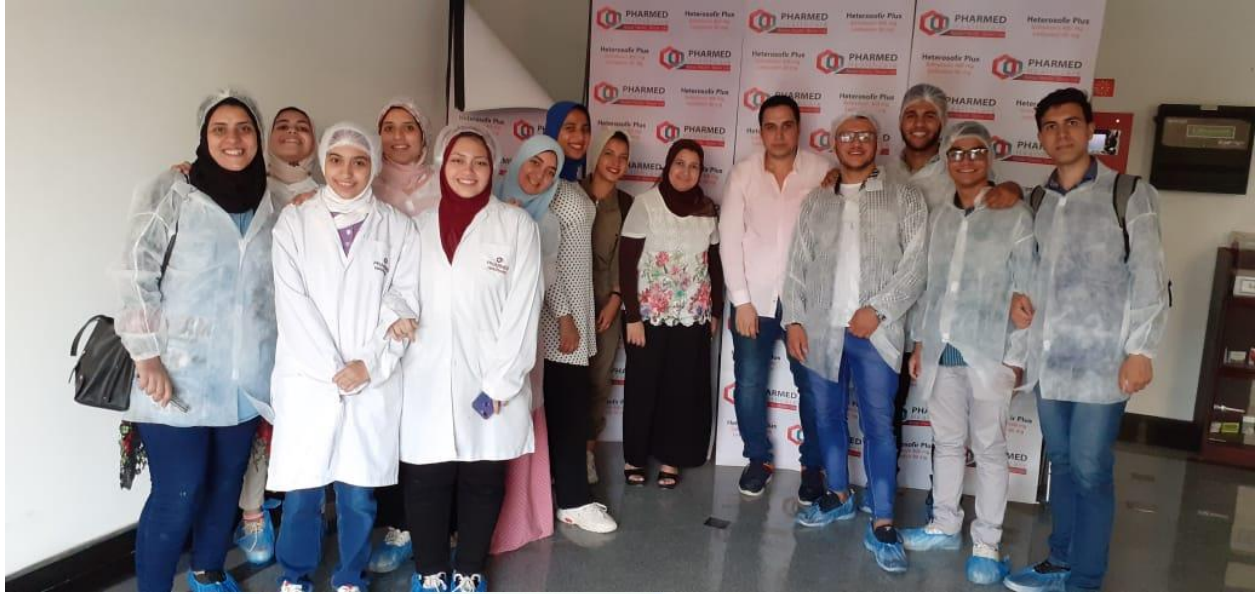
زيارة مصنع الأدوية فارما ميد هيلث كير