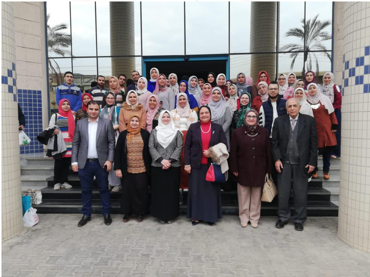
زيارة مصنع سيجمما للصناعات الدوائية