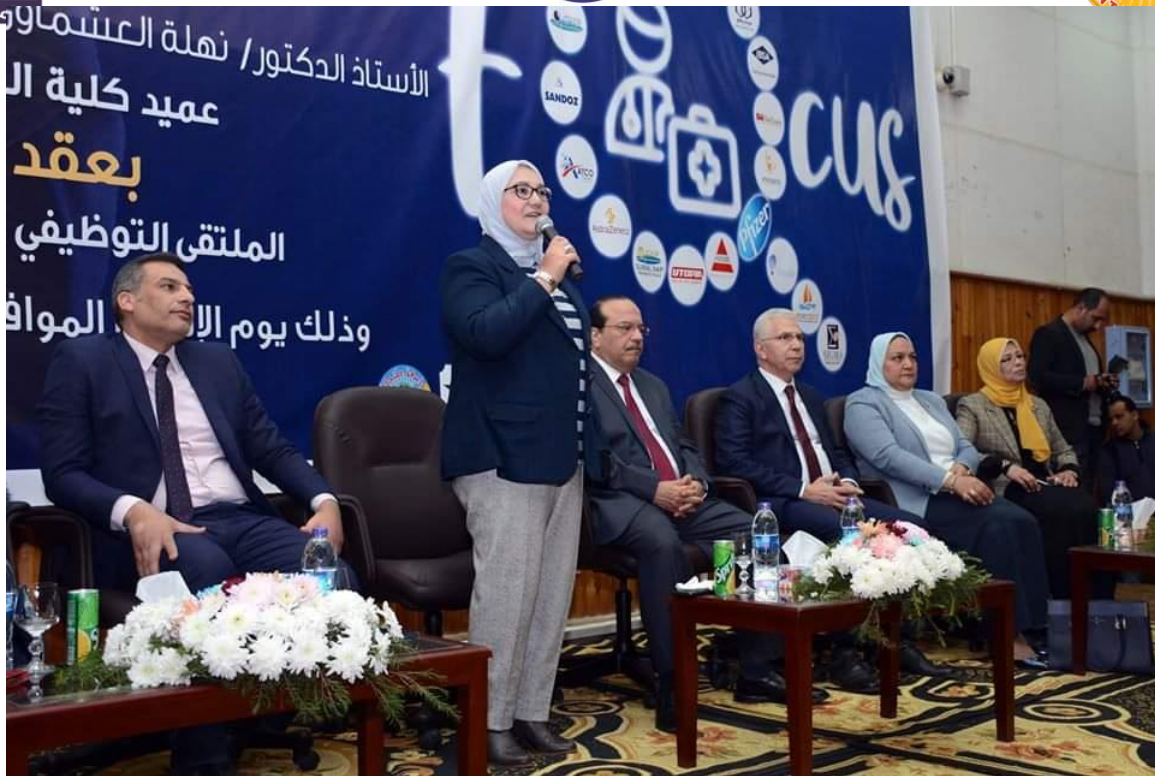
الملتقى التوظيفي السنوي فبراير 2020