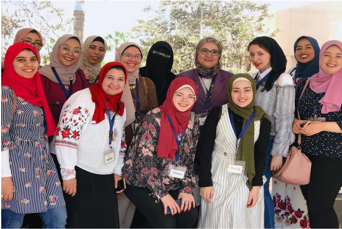
زيارة مصنع راميدا للصناعات الدوائية