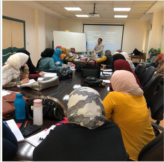
من دورة التغذية العلاجية