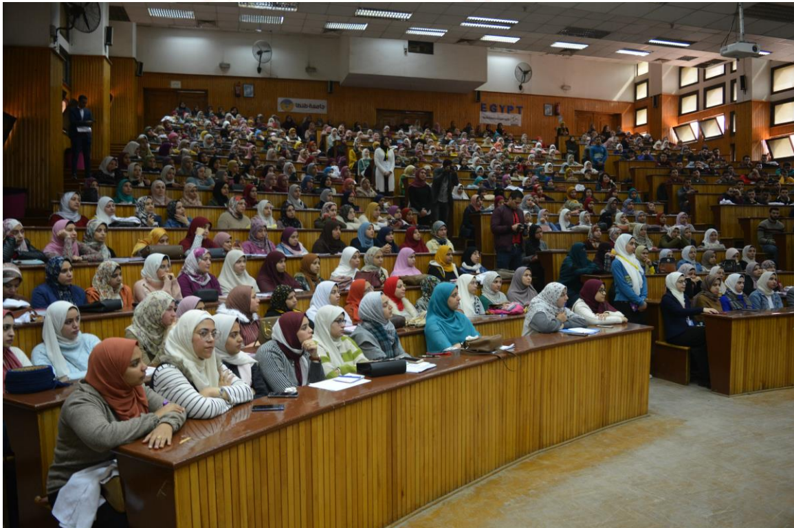
الملتقى التوظيفي السنوي فبراير 2020