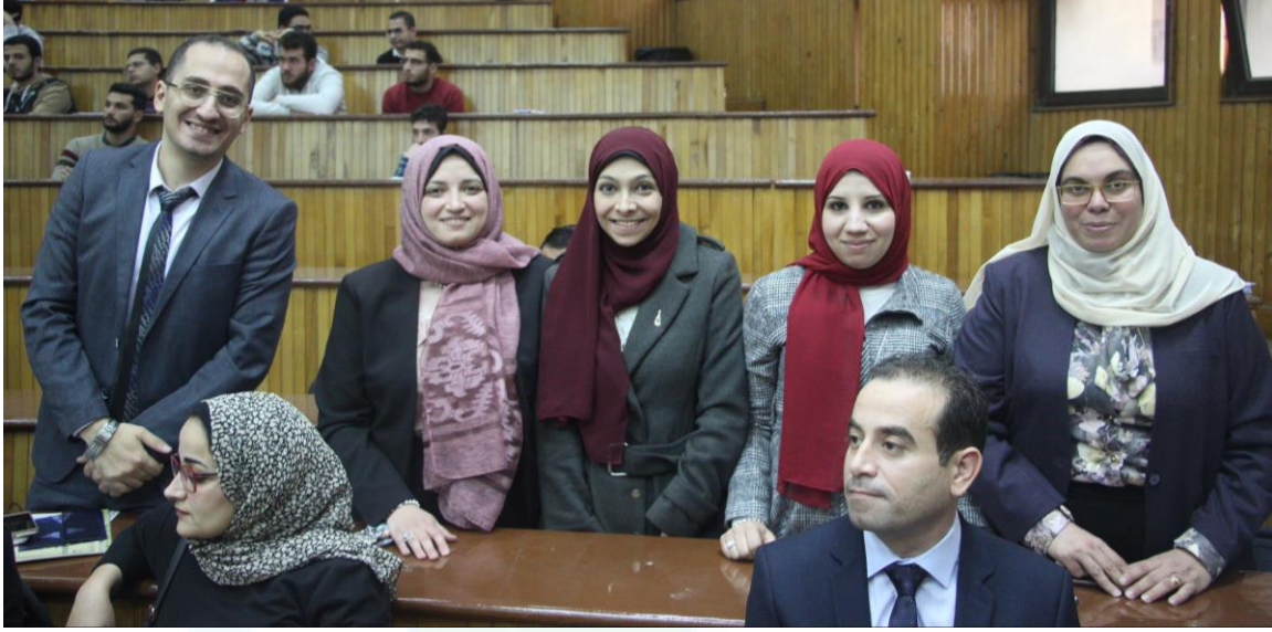
الملتقى التوظيفي السنوي فبراير 2020