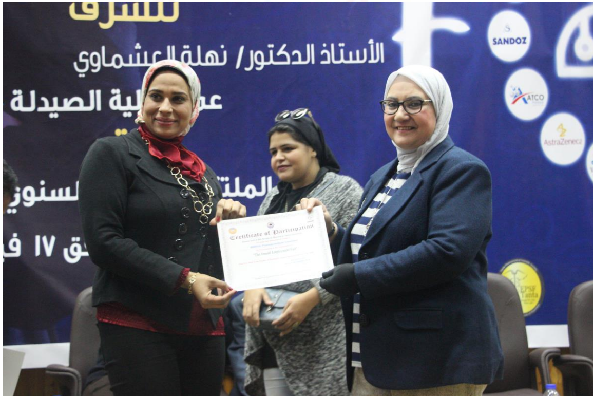
الملتقى التوظيفي السنوي فبراير 2020