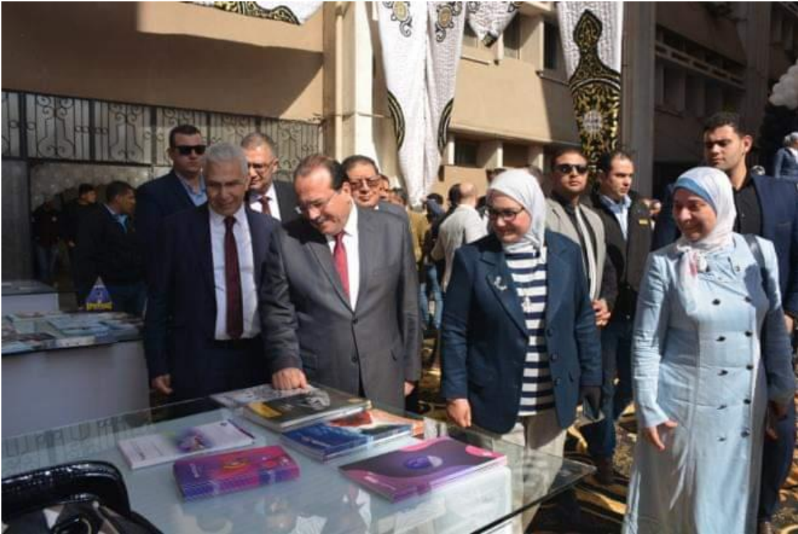
الملتقى التوظيفي السنوي فبراير 2020